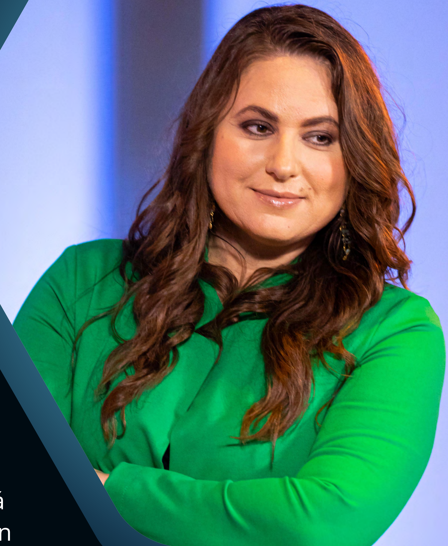
JUDIT POLGÁR VS THE WORLD / DUBAI

Köszönjük az együttműködést ügynökségi partnerünknek is, akik rengeteg kreatív ötlettel és professzionális szervezéssel, lebonyolítással járultak hozzá az interkontinentális műsor sikeréhez, és pillanatok alatt legyűrték bármilyen felmerülő nehézséget úgy, hogy az élő adásban ebből szinte semmit nem lehetett észrevenni.