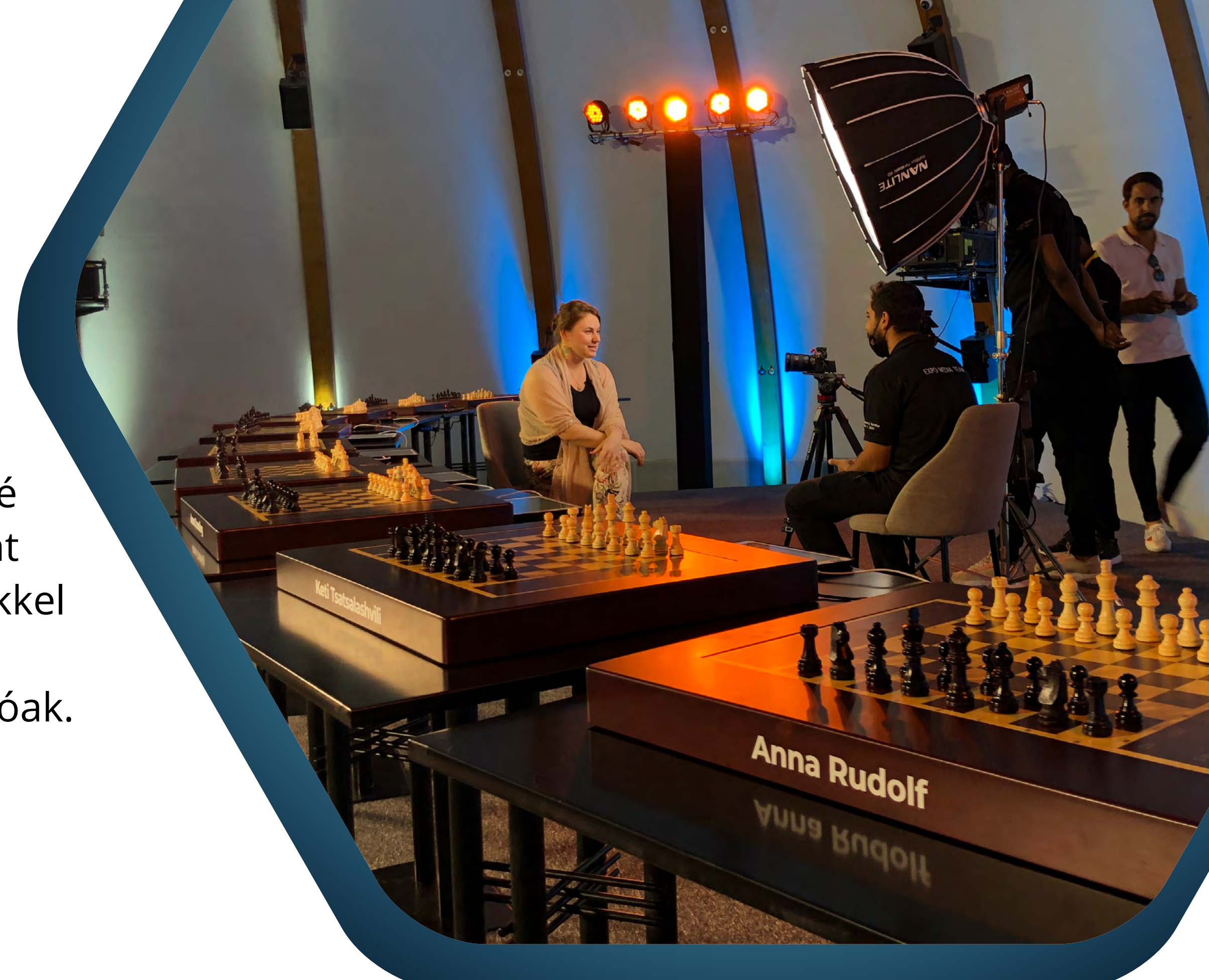
JUDIT POLGÁR VS THE WORLD / DUBAI

Ezt a közönséget ilyen jellegű impulzus még nem érte, pontosan ezért mentünk ebbe az egyedi irányba egy gamifikált, interaktív szimultánnal.