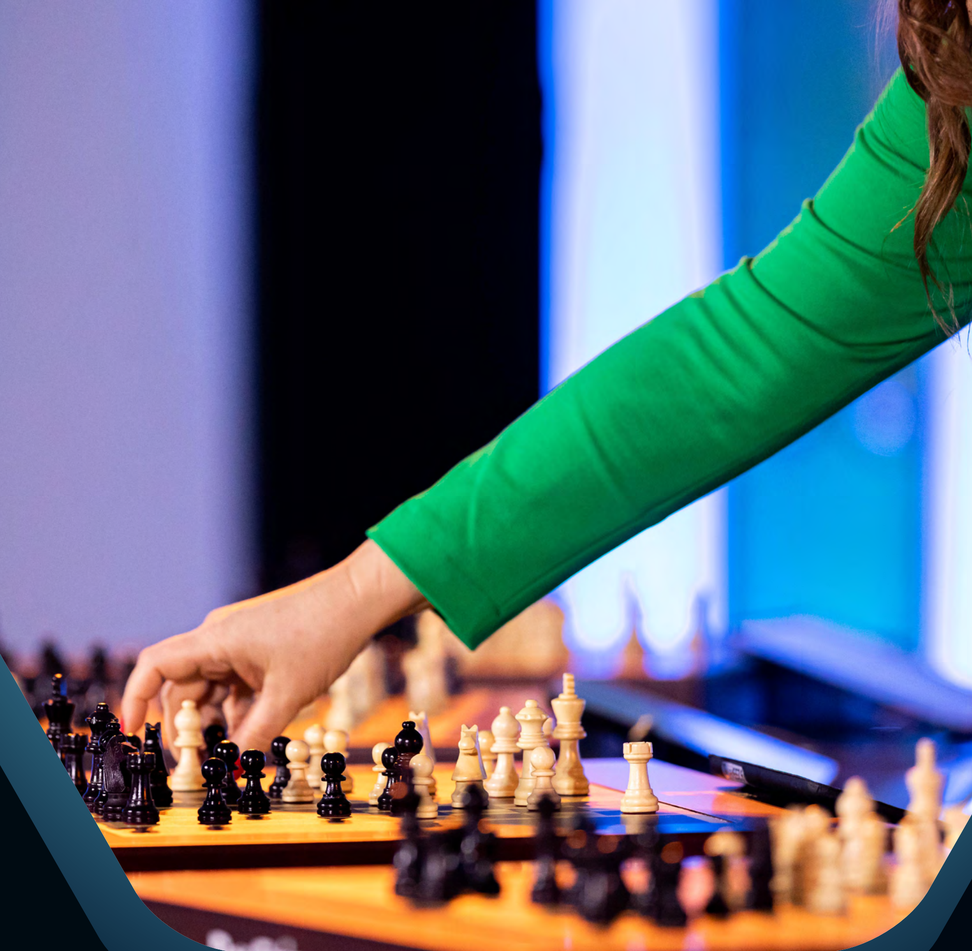
JUDIT POLGÁR VS THE WORLD / DUBAI

A közvetítés során fontos volt, hogy a laikusok és a profik is élvezhessék, mindenki átérezze annak fontosságát, hogy Judittal a középpontban az egész világ összefog egy közös cél érdekében: hogy egy nagyszerű világrekordot állítsunk fel.