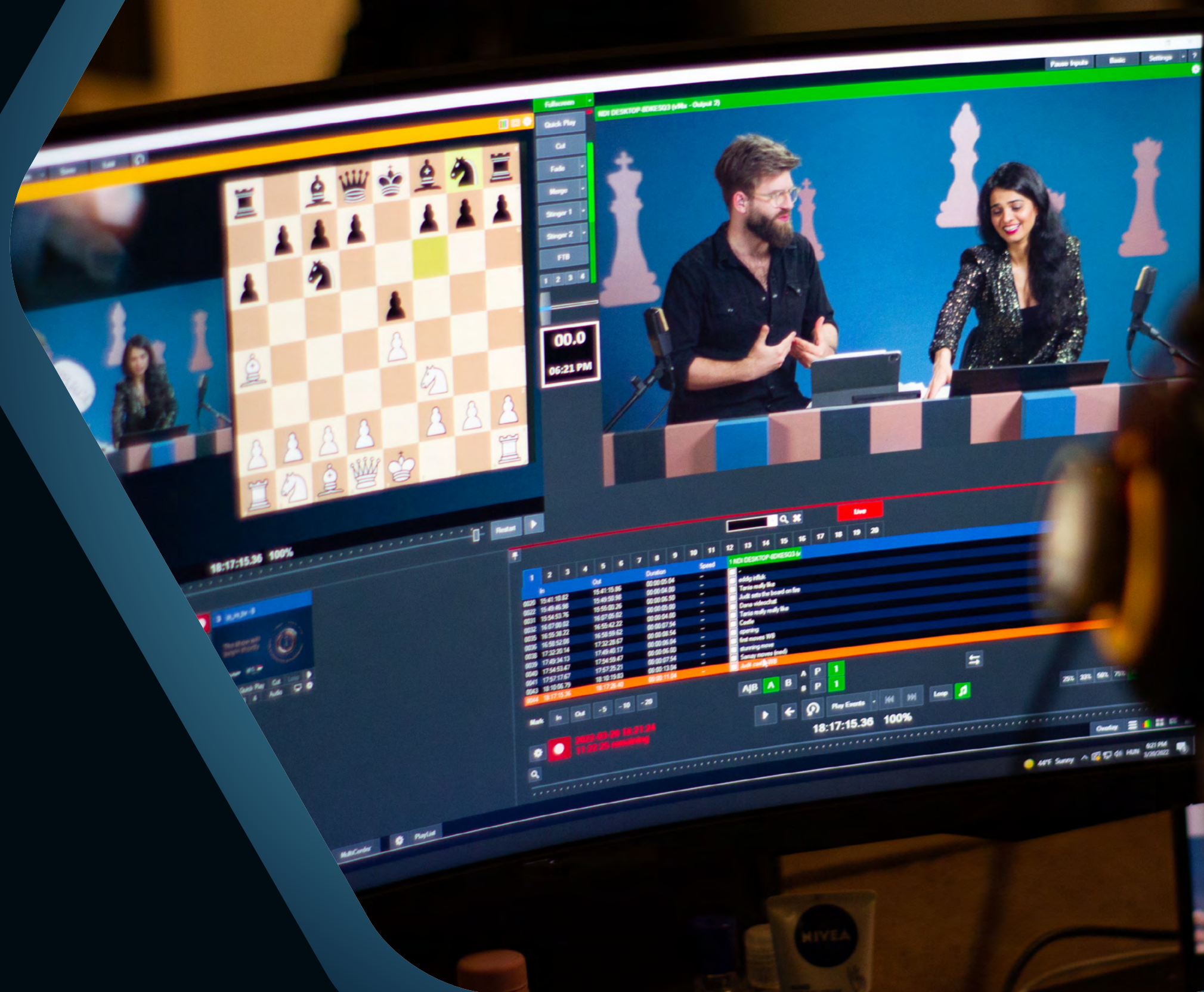
JUDIT POLGÁR VS THE WORLD / BUDAPEST