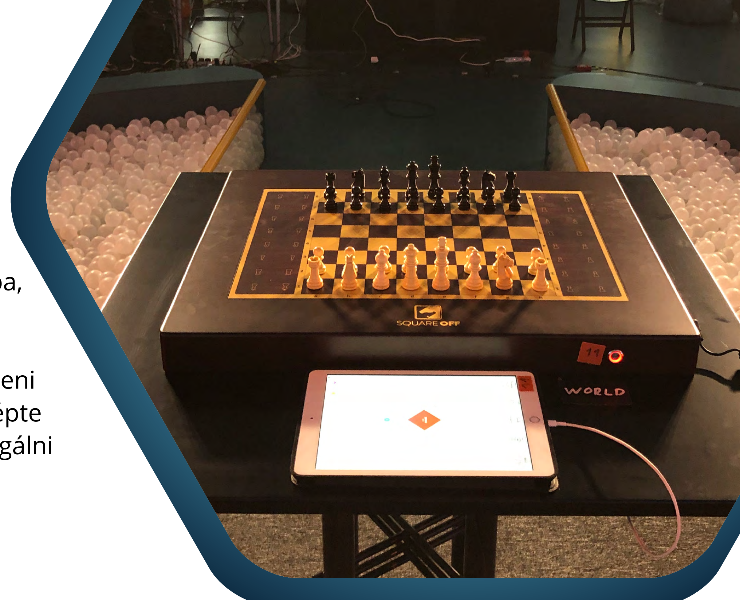
JUDIT POLGÁR VS THE WORLD / DUBAI

A Twitch, YouTube és Facebook streaming platformjainak lehetőségeit kihasználva chaten aktivizáltuk a nézőket és kaptunk folyamatos visszajelzést a műsorról, a legjobb ötleteket, kérdéseket pedig azonnal be is tudtuk építeni a show-ba. A teljes műsor ideje alatt élőben nyereményeket sorsoltunk a nézők között, ezzel is motiválva és még inkább elkötelezve az amúgy is lelkes közönséget.